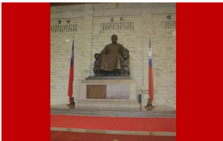
Pomník a socha prvého prezidenta na Taiwane – generála Chiang-kai-sheka

Ostrov bol Číňanom známy už od 1. storočia pred Kristom. V 13. storočí sa stal správnym územím Číny a od konca 15. storočia tam mali Číňania svoje vojenské posádky. Roku 1590 pristáli na ostrove Portugalci, ktorí ho nazvali Formoza (Ilha Formoza – Prekrásny). V 17. storočí obsadili časť ostrova Holanďania. Roku 1661 ich z neho vyhnal generál Čeng Čcheng-kung. Po čínsko-japonskej