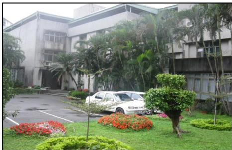
Budova jezuitského školastikátu v Taipei

Z Hongkongu 800 km na severovýchod, Boeingom 777-300 leteckej spoločnosti Cathay Pacific, s kapacitou okolo 700 miest, som v stredu, 3. februára 2010 pristál na letisku v Taipei. Už prvá noc v jezuitskom školastikáte ma presvedčila o tom, že čím viac sa na mojej ceste približujem k Číne, tým viac sa mi odkrýva reálna chudoba prostredia, v ktorom sa ocitám. Už len realita drevenej posteľe, ktorá nemá ani matrac, len hrubšiu deku na drevenej doske, je veľavravný. Nehovoriac o možnosti len studenej vody či neustáleho nadpriemerného hluku klimatizačných turbín z vedľajšej budovy, až po otvorený takmer celonočný zápas s „veľmi prefikávanými“ komármi. Keďže počas zimy sa tu teplota pohybuje okolo 10 – 15 stupňov, zároveň je tu vysoká vlhkosť a bez možnosti kúrenia, je úplne normálne, že je potrebné mať často v izbe oblečený nielen jeden, ale aj dva svetre, prípadne aj